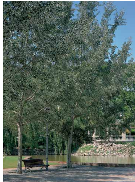
Àlbers prop del llac

Desmés al costat de l'aigua, àlbers en la gran plaça rodona, plàtans i palmeres de Canàries flanquejant el camí de ponent, xiprers, casuarines, robinies i cedres són alguns dels elements més remarcables de la vegetació.