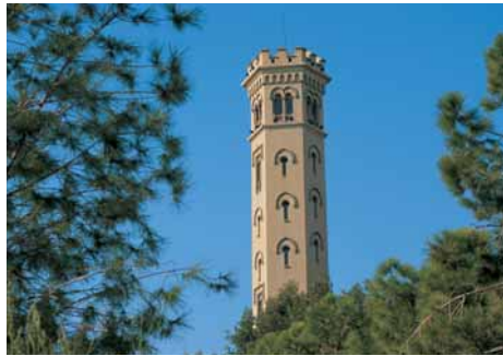
Torre de la Miranda

Malgrat que ja no es destina als usos per als quals es va construir, la torre és avui una fita singular del paisatge de Cornellà. Es tracta d'un edifici d'estil neomudèjar, de planta hexagonal i uns 30 metres d'alçada, dividit en quatre cossos separats per cornises. El cos principal conté quatre pisos de gracioses finestres recobertes per un gran coronament. El cos superior, amb grans finestres geminades, és destinat a mirador i damunt seu una miranda descoberta amb barana emmerletada corona la torre. L'airostat de l'edifici li prové de la seva esveltesa i sobretot del gran nombre d'obertures.