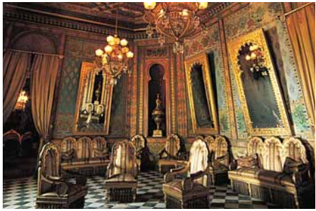
Interiors del palau. Ajuntament de Cornellà

Com que la família havia deixat la seva residència al Passeig de Gràcia de Barcelona per instal·lar-se definitivament a Cornellà, el trasllat inclogué les col·leccions privades d'armes, ceràmiques, vestits, animals dissecats, fòssils, nius d'ocells i altres objectes que formaven el "Museu del Comte de Bell-lloc". Entre els anys 1990 i 2004, el palau ha estat objecte de successives fases de rehabilitació, que van permetre que ja el 1995, s'obris al públic com a museu d'arts plàstiques i decoratives i com a seu d'actes culturals i de casaments civils.